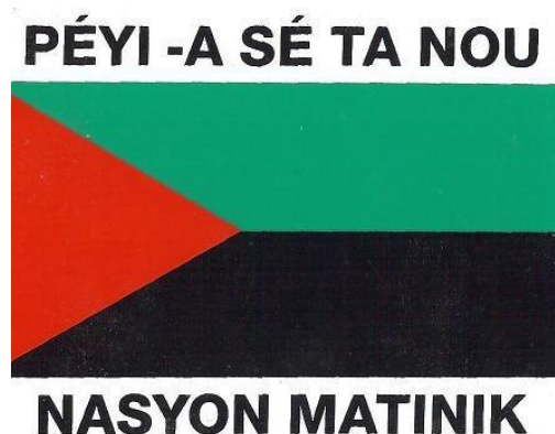
04 – Le drapeau Nasyon Matinik, le plus populaire