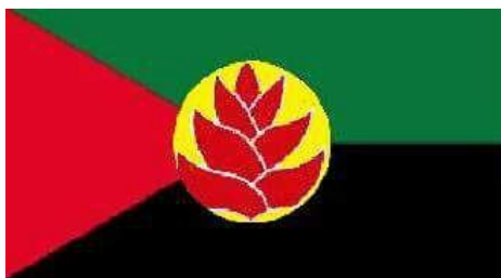
03 - Le drapeau que proposerait le PPM