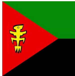
02 - Le drapeau que proposerait le MIM