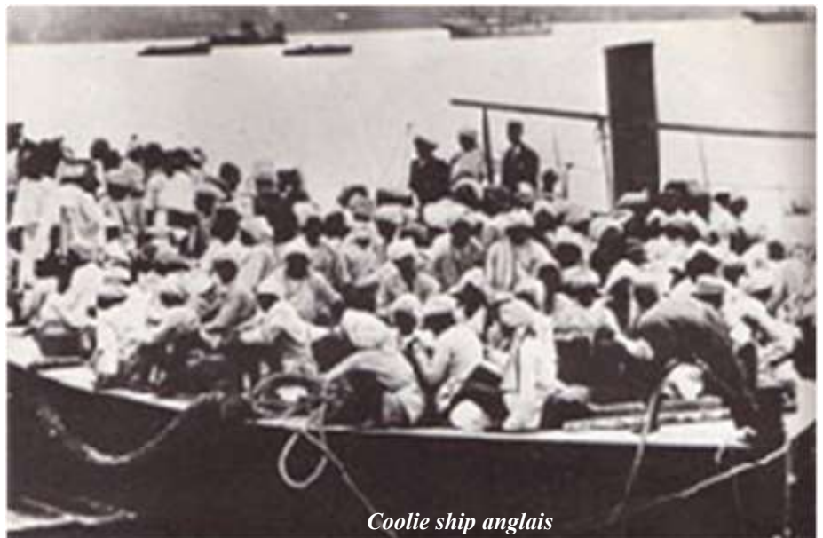
Coolie ship anglais

(*) Enseigne de vaisseau ayant voyagé à bord de l' Alix , allant de Pondichéry à la Guadeloupe en 1856