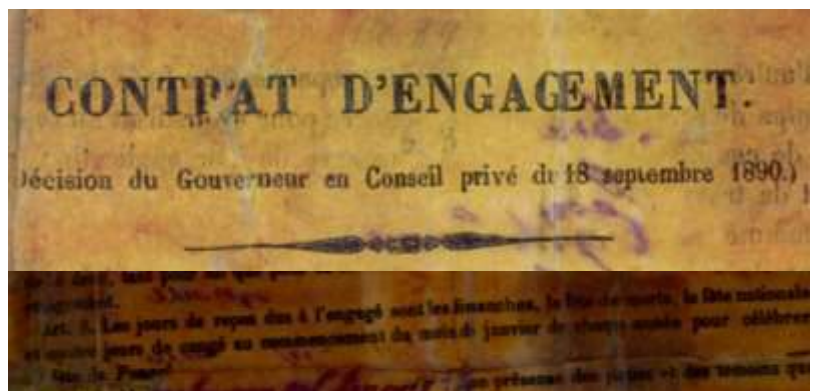
"Article 8. Les jours de repos dus à l'engagé sont les dimanches, la fête des morts, la fête nationale et quatre jours de congé au commencement du mois de janvier de chaque année pour célébrer la fête du Pongal."