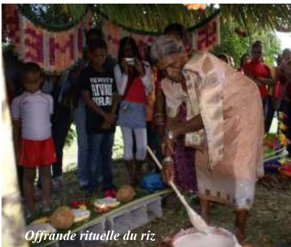
Offrande rituelle du riz

selon la tradition du Pongal, partie artistique (Musique et chants traditionnels tamouls) Le Pongal était la seule pé-