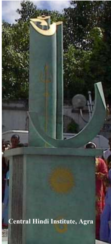
Central Hindi Institute, Agra

Ce sont d'abord les facteurs économiques qui sont déterminants pour favoriser une certaine adhésion des planteurs et des négociants à l'abolition de l'esclavage. En fait, l'esclavage ne rapporte plus. s'il était encore « rentable », c'est grâce aux subventions octroyées par l'état pour l'acheminement de la main d'œuvre noire. La thèse des économistes du début du XIX e siècle contre l'aberration économique que constitue l'importation d'une