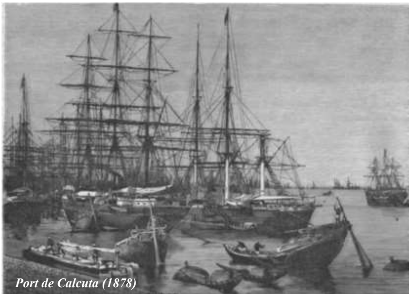
Port de Calcuta (1878)